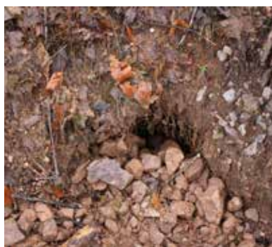
Dégâts causés par les blaireaux

- 4 944,50 € TTC de travaux réalisés par l'entreprise Lepaul selon devis principal de 3 707 € TTC et devis complémentaire pour abattage supplémentaire de 1 237,50 € TTC.