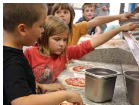
Chez Grey's Pizza