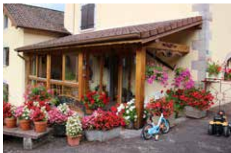
Mme Odile DAVAL

Tous les candidats se sont vus offrir un prix ou un bon d'achat, accompagné de la photographie de leur maison.