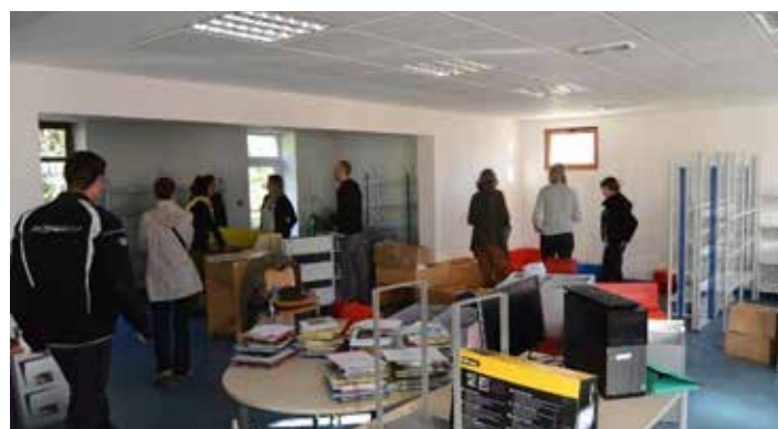
Visite du personnel de la Médiathèque de la C.C.P.V.M.