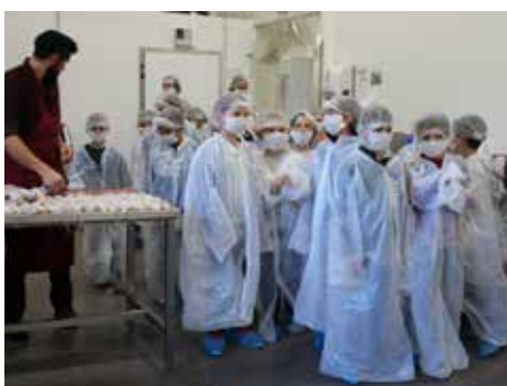
Au Palais de l'Andouille

Les enfants des écoles ont investi les locaux des artisans de bouche ajolais tout au long de la semaine qui s'est terminée par la balade du goût sur les hauteurs du Fricounot avec une dégustation de produits locaux.