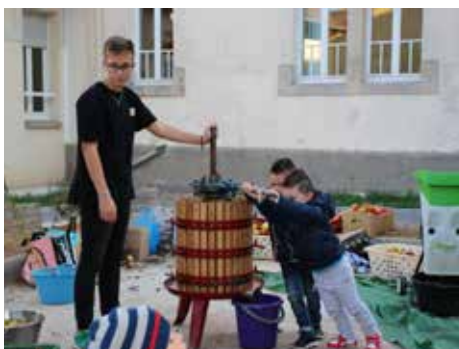
A l'Ecole du Centre : jus de pomme