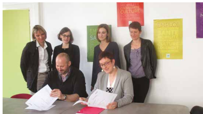
Signature de l'accord de partenariat avec Actua, en avril 2016 : La Mission Locale travaille en synergie avec l'Agence d'emploi Actua, afin de proposer aux jeunes des réponses multiples, efficaces et adaptées.

Associations, cet espace vous est destiné. N'hésitez pas à nous communiquer vos animations sur ticket@valdajol.fr .