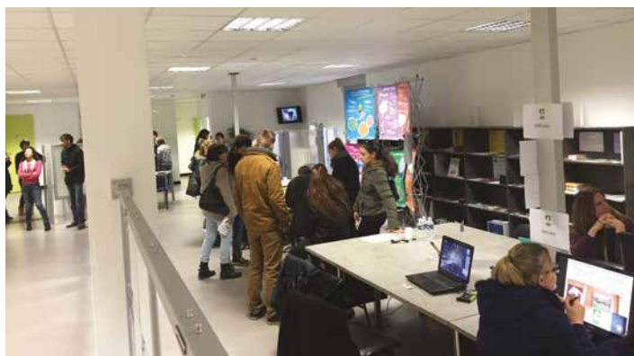
Forum Mobilité Internationale en janvier 2016 : L'objectif de cette journée était d'informer sur les différents dispositifs et opportunités de séjour à l'international, en particulier pour le public jeune.

8h30 à 12h00 (sauf mardi matin) et 13h15 à 17h00