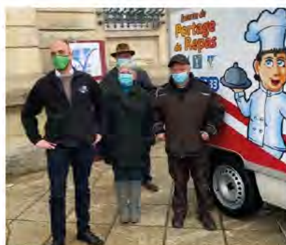
Livraison du nouveau véhicule - Décembre 2020

Pour tous renseignements complémentaires, vous pouvez vous adresser à votre mairie, ou plus spécifiquement à celle du Val d'Ajol qui est chargée de la gestion de ce service.