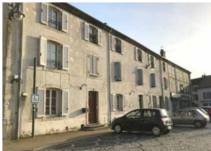
Bâtiment du Presbytère