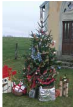
La chapelle du Moineau