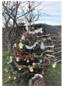
La croisette