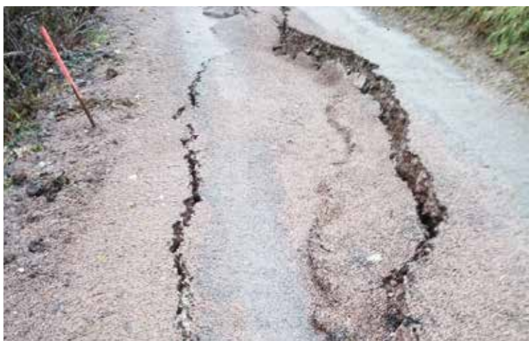
Accès à une habitation principale