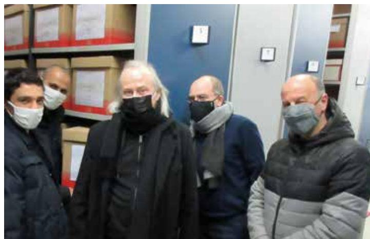
Vosges Matin - Les acteurs du projet