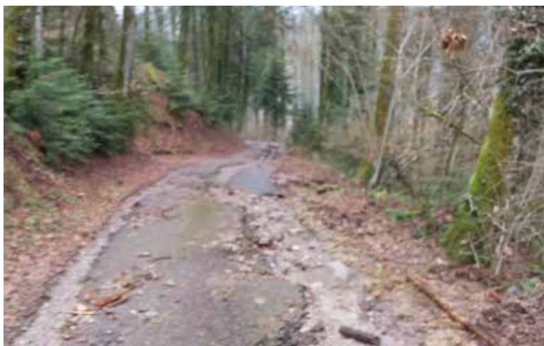
Route de la Combelle