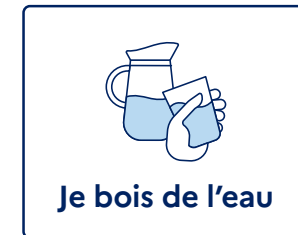
Je bois de l'eau