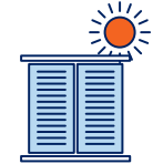
Je ferme les volets et fenêtres le jour, j'aère la nuit