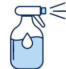
Je mouille mon corps