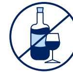
J'évite de boire de l'alcool