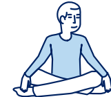
Je fais des activités sans effort