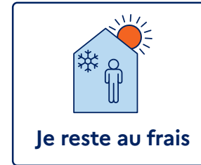
Je reste au frais